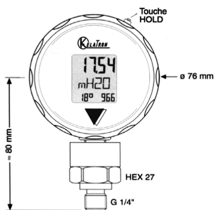
Version -1...2 bar

■ Dans son mode de mesure standard, le Mano KALI affiche la pression actuelle, l'unité et les pressions mini et maxi.