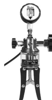
Pompe manuelle HTP à eau ou à huile 700 bar