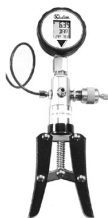
Pompe manuelle K/P - 0.85 ... 20 bar